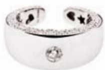
RING 750/- Weißgold | Brillanten 0,82 ct € 3.600,-