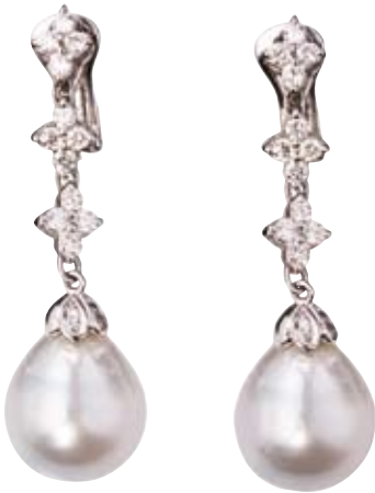
PERLOHRRINGE 750/- Weißgold | Brillanten 1,04 ct € 5.400,-