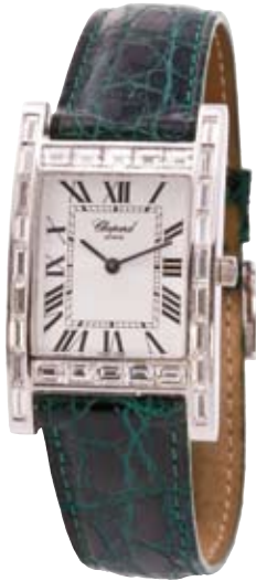
ORIGINAL CHOPARD 750/- Weißgold | Brillanten € 36.300,-