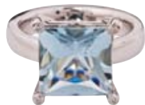
RING 750/- Weißgold | Aquamarin 4,43 ct Brillanten 0,06 ct € 2.800,-