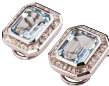
OHRRINGE 750/- Weißgold | Brillanten 2,65 ct Aquamarin 7,72 ct € 17.380,-