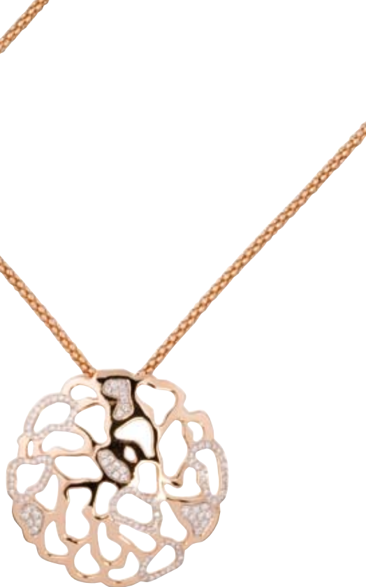
COLLIER 750/- Roségold | Brillanten 0,48 ct € 2.850,-