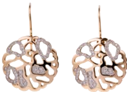
OHRRINGE 750/- Roségold | Brillanten 0,31 ct € 1.900,-