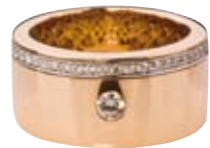
RING 750/- Weiß- und Roségold | Brillanten 0,45 ct € 3.400,-