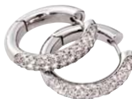
OHRRINGE 750/- Weißgold | Brillanten 2,4 ct € 5.700,-