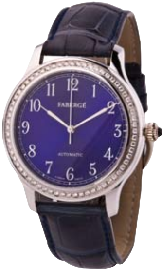
ORIGINAL FABERGÉ 750/- Weißgold | Brillantlunette 0,96 ct