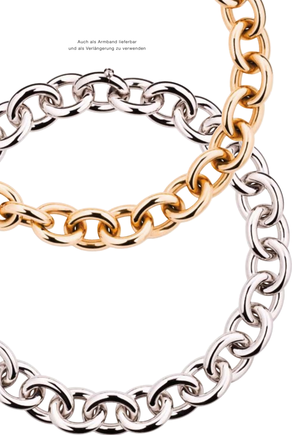
GROSSE ANKERKETTE 750/- Weißgold Brillantverschluss 0,12 ct € 18.960,-

Auch als Armband lieferbar und als Verlängerung zu verwenden