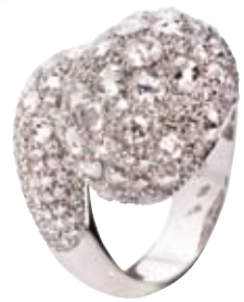
RING 750/- Weißgold | Brillanten 7,19 ct € 21.450,-