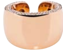
RING 750/- Roségold | Brillanten 0,55 ct € 3.600,-