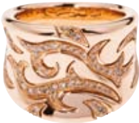
RING 750/- Roségold | Brillanten 0,62 ct € 3.000,-