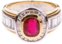
RING 750/- Weiß- und Gelbgold | Rubin 1,52 ct Brillanten und Baguettes 1,63 ct € 23.350,-