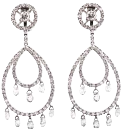
OHRRINGE 750/- Weißgold | Brillanten 14,93 ct € 31.080,- COLLIER 750/- Weißgold | Brillanten 2,93 ct € 10.890,-