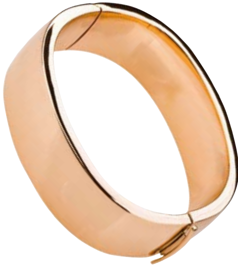
ARMREIF 750/- Roségold € 4.150,-