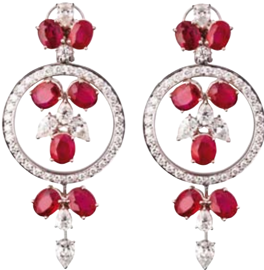
OHRRINGE 750/- Weißgold | Burma Rubine 29,15 ct Brillanten 9,82 ct € 125.000,-