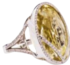
RING 750/- Weißgold | Citrin 80,11 ct Brillanten 1,3 ct € 11.000,-