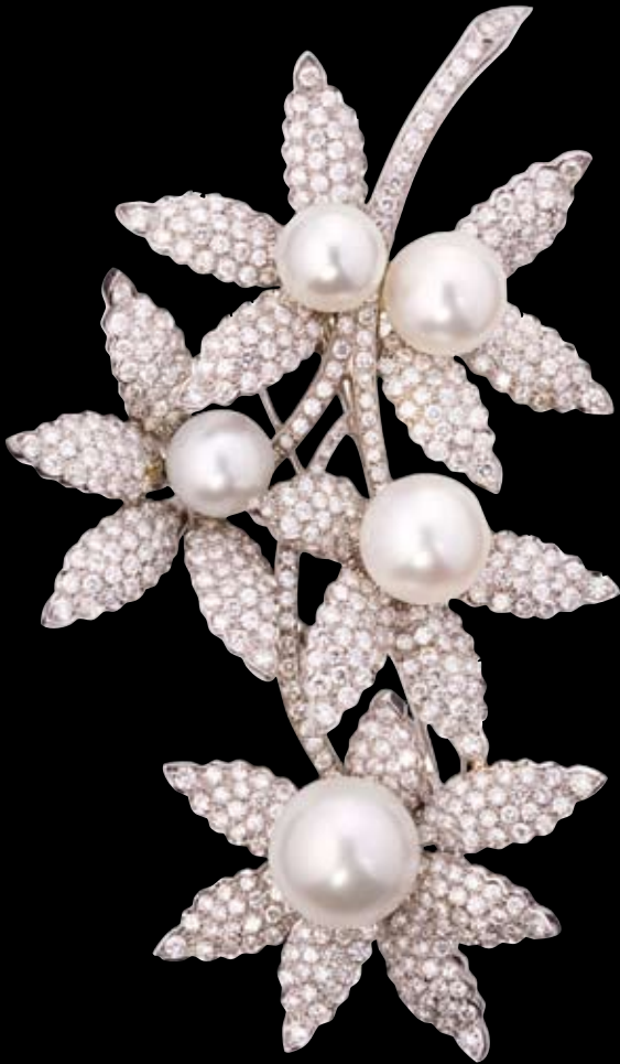
BROSCHÉ 750/- Weißgold | Perlen | Brillanten 16,93 ct € 43.500,-