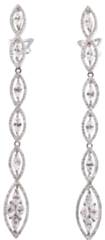
OHRRINGE 750/- Weißgold | Brillanten 2,88 ct € 10.560,-