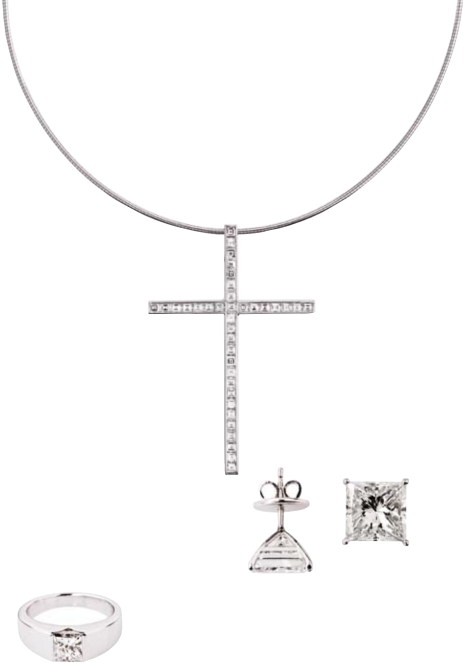
RING 750/- Weißgold | Brillanten 1,51 ct € 19.800,-