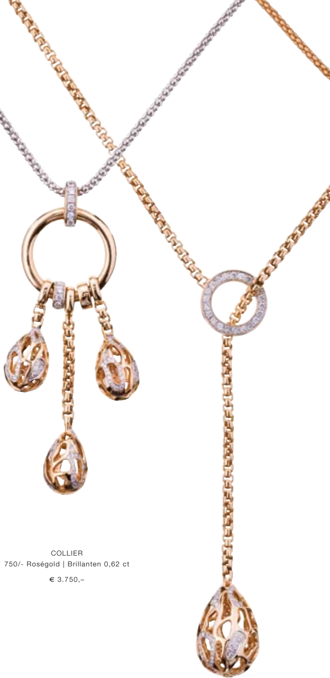
COLLIER 750/- Roségold | Brillanten 0,62 ct € 3.750,-