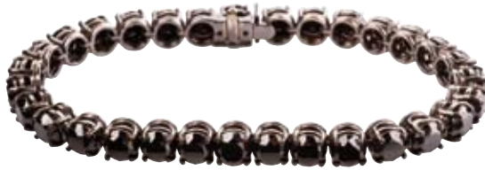
ARMBAND 750/- Weißgold | Schwarze Brillanten 25,4 ct € 9.000,-