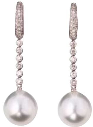
OHRRINGE 750/- Weißgold | Citrin 29,95 ct Brillanten 5,79 ct € 24.990,-