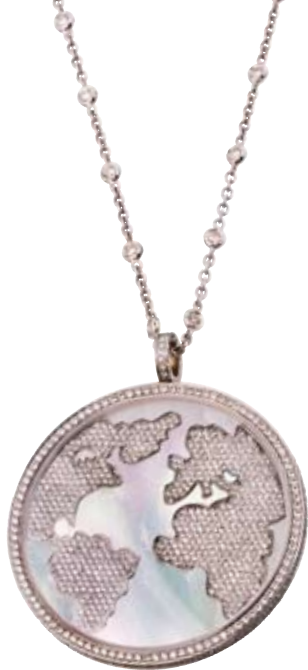
JACOB & CO. ANHÄNGER

Ohne Kette | 750/- Weißgold | Brillanten 6,07 ct € 23.440,-