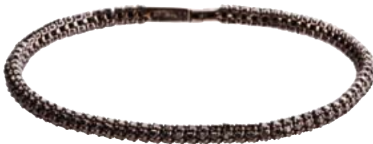
ARMBAND Schwarze Brillanten 8,02 ct € 7.900,-