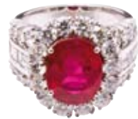
RING 750/- Weißgold | Rubin 5,07 ct Brillanten 4,31 ct € 68.000,-