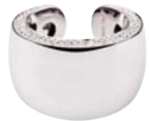
RING 750/- Weißgold | Brillanten 0,55 ct € 3.600,-