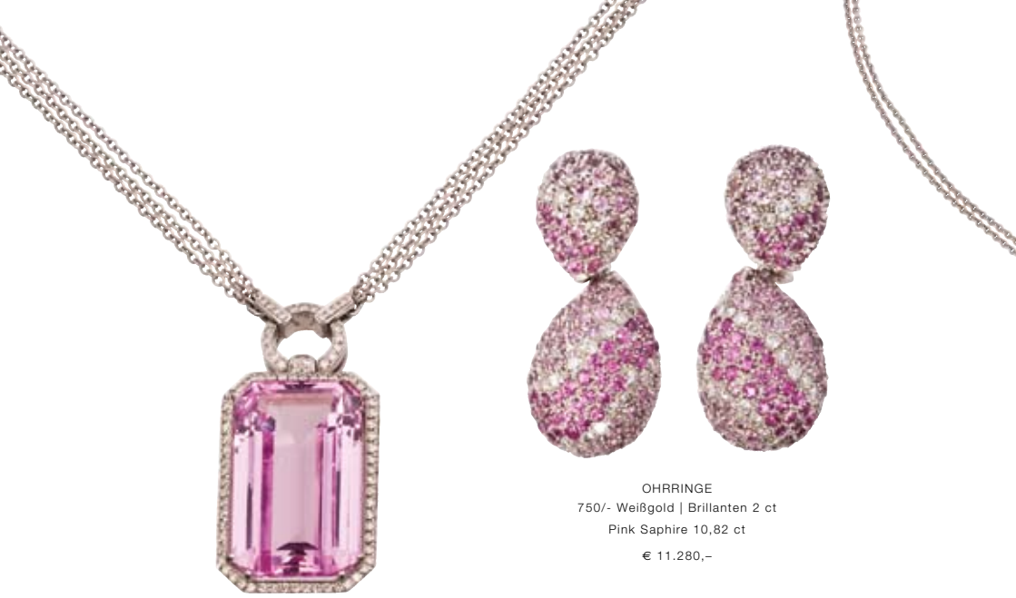
OHRRINGE 750/- Weißgold | Brillanten 2 ct Pink Sapphire 10,82 ct € 11.280,-