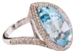
RING 750/- Weißgold | Aquamarin 17,30 ct Brillanten 1,67 ct € 13.150,-