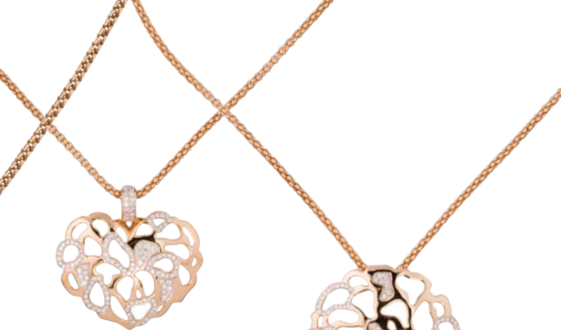
COLLIER 750/- Roségold | Brillanten 0,61 ct € 3.150,-