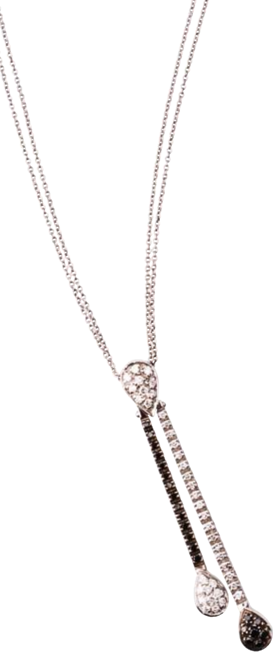
COLLIER SCHWARZE BRILLANTEN 750/- Weißgold | Schwarze und weiße Brillanten 0,58 ct € 2.400,-