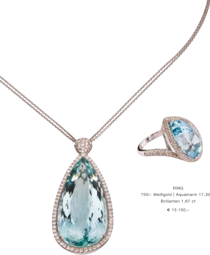
COLLIER 750/- Weißgold | Aquamarin 77,03 ct Brillanten 1,97 ct € 16.200,-