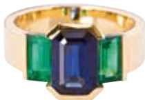
RING Original Cartier 750/- Gelbgold | Saphir 2,9 ct Smaragd 1,46 ct € 14.800,-