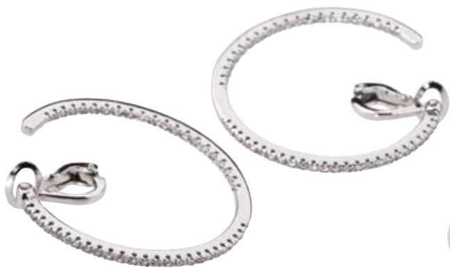
OHRRINGE 750/- Weißgold | Brillanten 0,82 ct € 3.450,-