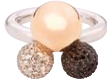
RING 750/- Weißgold | 750/- Roségoldkugel Brillanten 1,53 ct | Schwarze Saphire 1,56 ct € 7.200,-