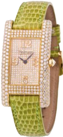
HEILMANN WATCH – LIMITIERTE AUFLAGE 750/- Gelbgold | Brillanten 6,5 ct Brillanziffern erhaben € 11.900,-