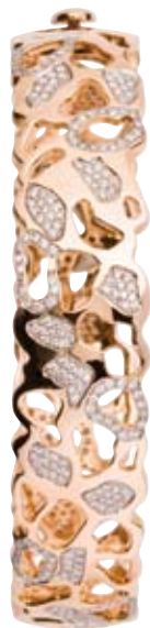
ARMBAND 750/- Roségold | Brillanten 1,64 ct € 8.900,-