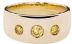
RING 750/- Gelbgold | Citrin € 1.800,-