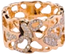
RING 750/- Roségold | Brillanten 0,34 ct € 2.000,-