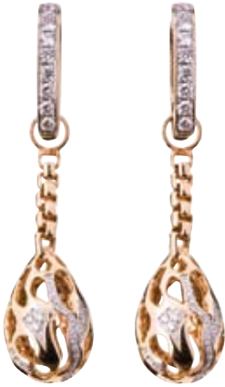
OHRRINGE 750/- Roségold | Brillanten 0,34 ct € 2.100,-