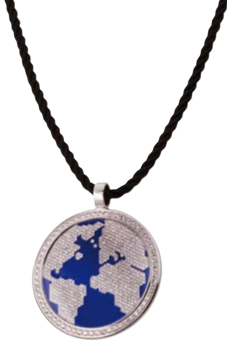
JACOB & CO. KETTE

Ohne Kette | 750/- Weißgold | Brillanten 6,07 ct € 23.440,-