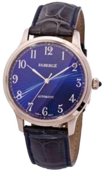
ORIGINAL FABERGÉ 750/- Weißgold