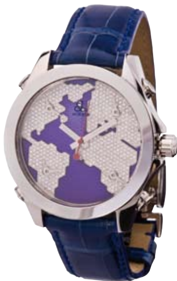
ORIGINAL JACOB & CO.

Weißer Welt | Brillanten 5,75 ct 5 Zeitzonen € 25.300,-