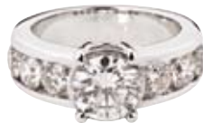
RING 750/- Weißgold | Brillanten 3,64 ct € 23.500,-