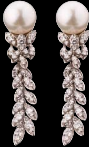
OHRRINGE 750/- Weißgold | Perlen | Brillanten 5,42 ct € 12.900,-

Die Größen der im Katalog abgebildeten Schmuckstücke und Uhren entsprechen nicht der Originalgröße, Farben können drucktechnisch bedingt vom Originalschmuckstück abweichen. Die Preise sind unverbindlich inkl. MwSt. Preisänderungen und Irrtümer vorbehalten.