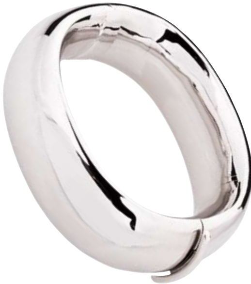
ARMREIF 750/- Weißgold € 6.000,-