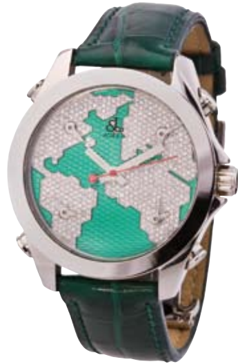
ORIGINAL JACOB & CO. Grüne Welt Brillanten 2 ct 5 Zeitzonen € 16.500,-