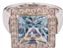
RING 750/- Weißgold | Aquamarin 5,04 ct Brillanten 0,36 ct € 4.500,-