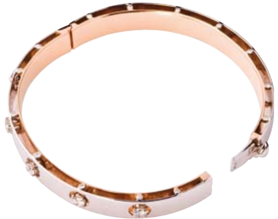
ARMREIF 750/- Weiß- und Roségold | Brillanten 0,97 ct € 7.300,-