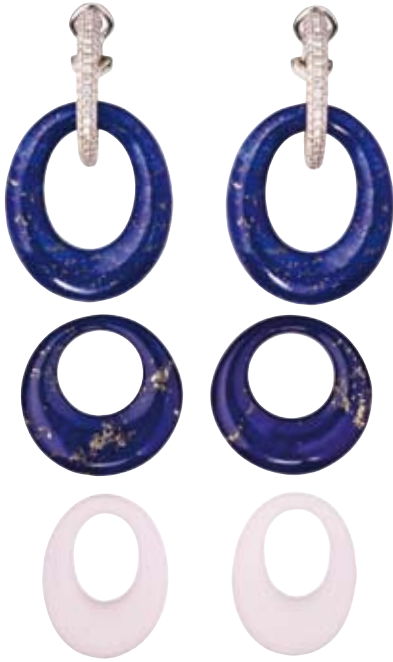
CREOLEN 750/- Weißgold | Brillanten 1,93 ct