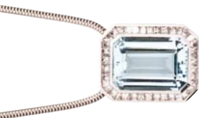
COLLIER 750/- Weißgold | Aquamarin 14,73 ct Brillanten 2,65 ct € 17.950,-