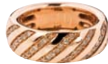
RING 750/- Roségold | Weiße und grüne Brillanten 0,59 ct € 1.600,-