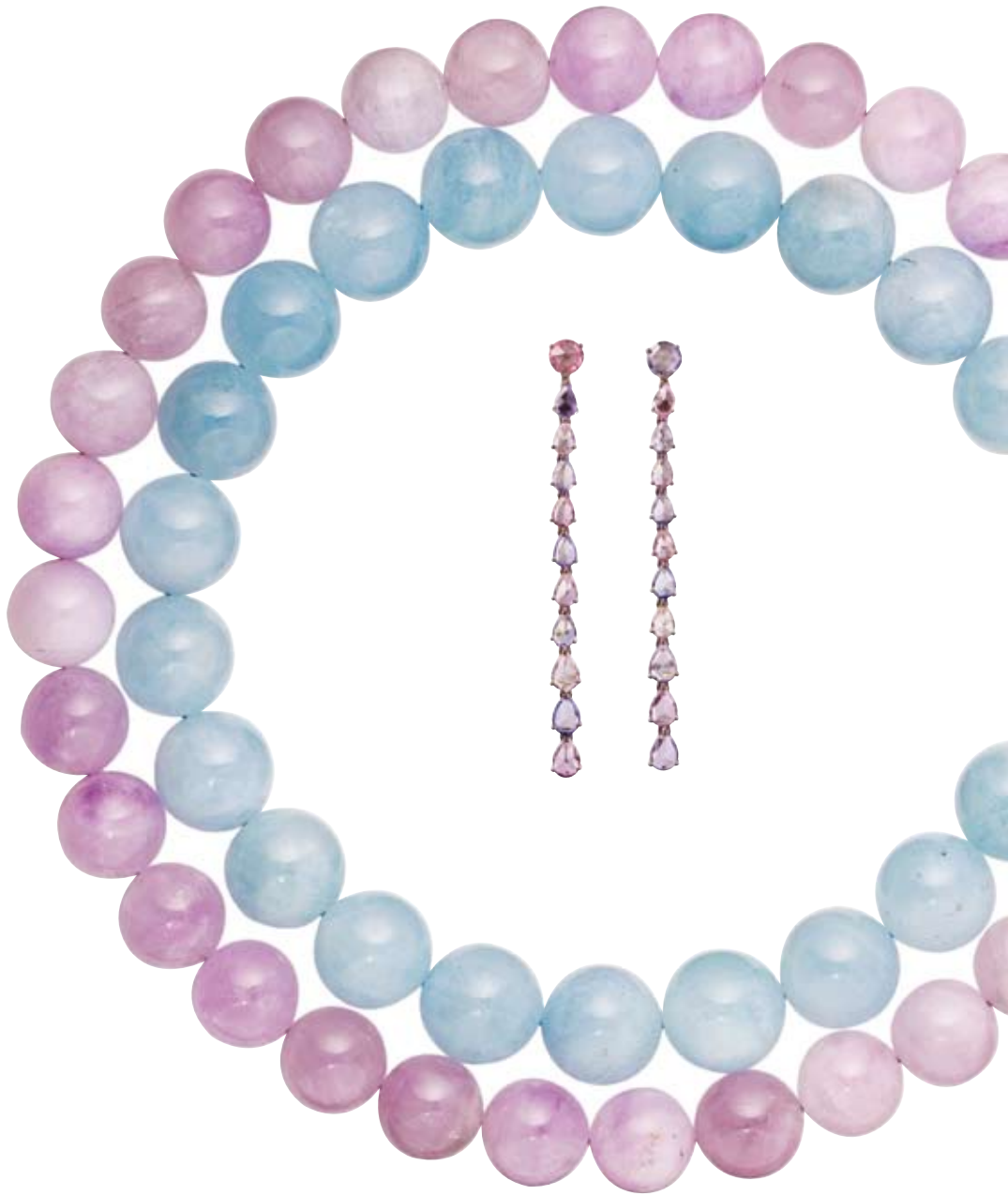
PERCOLLIER Aquamarine | 22 Perlen € 950,-