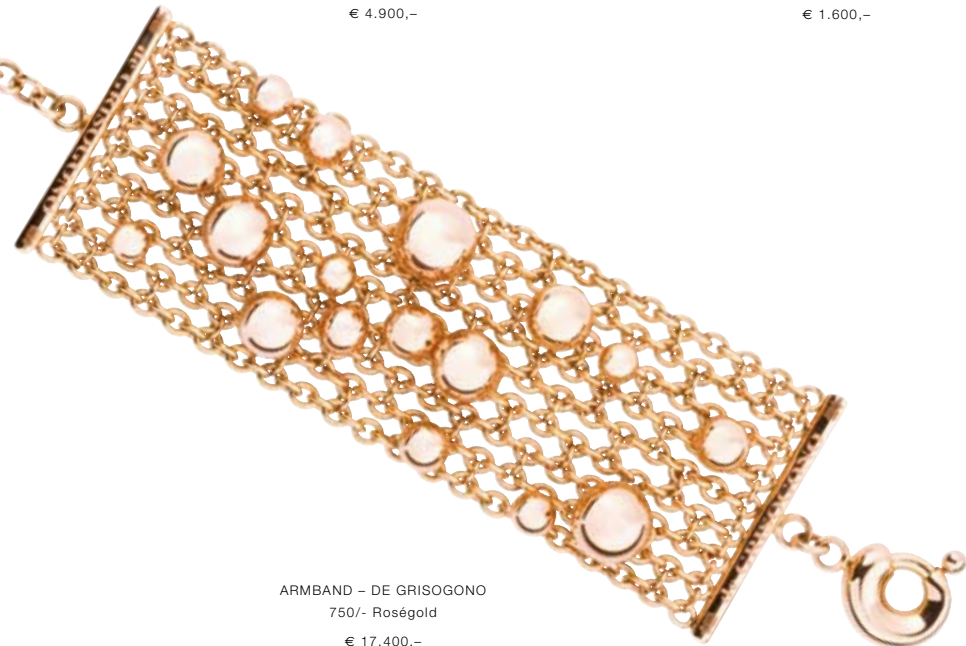
ARMBAND – DE GRISOGONO 750/- Roségold € 17.400,-