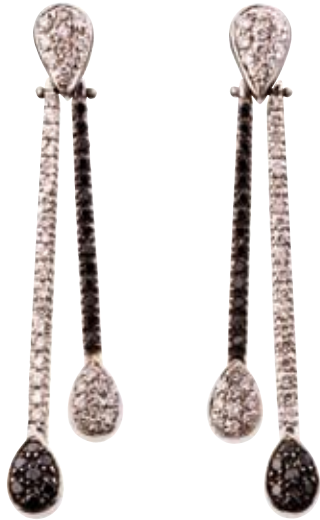
OHRRINGE 750/- Weißgold | Schwarze und weiße Brillanten 1,16 ct € 3.950,-