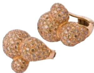
PAVÉ-OHRRINGE 750/- Roségold Cognacfarbene Brillanten 14,41 ct € 15.800,-