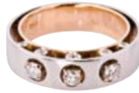
RING 750/- Weiß- und Roségold | Brillanten 0,34 ct € 2.050,-