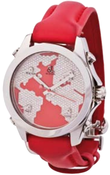
ORIGINAL JACOB & CO. Rote Welt Brillanten 4 ct 5 Zeitzonen € 19.200,-