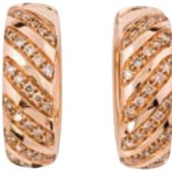
OHRRINGE 750/- Roségold | Weiße und grüne Brillanten 0,86 ct € 4.900,-