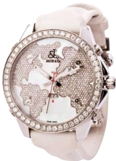
ORIGINAL JACOB & CO.

750/- Weißgold | Brillanten 2,76 ct € 18.000,-