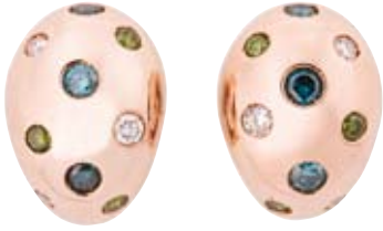
OHRRINGE 750/- Roségold | Weiße und grüne Brillanten 0,92 ct Blaue Brillanten 0,94 ct € 5.500,-